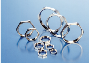
Hexagonal Lock Nut metric thread