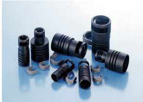
Conduit Adapter IP66