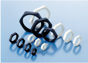
Hexagonal Lock Nut metric thread